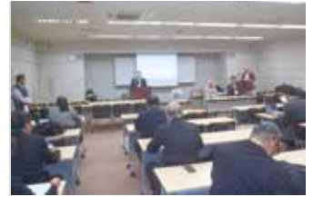
年末報告会の状況