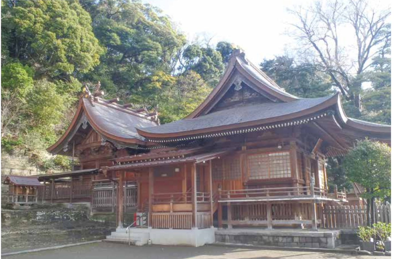
金沢区 瀬戸神社 (八幡造り)

一般社団法人 神奈川県建築士事務所協会 横浜支部 https://www.kkj-yokohama1.jp E-mail : yokohamashibu@kkj-yokohama1.jp