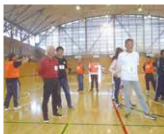
カローリング競技前

来年のスポーツ大会は川崎支部で開催とのこと。汚名挽回のために参加を誓う次第です。